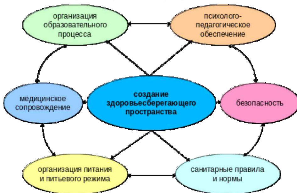
Модель здоровьесберегающей инфраструктуры МАОУ СОШ № 23

Вопросы внедрения здоровьесберегающих технологий в образовательный процесс систематически обсуждаются на заседаниях педагогического совета школы. На заседаниях педагогического совета обсуждался следующий вопрос по здоровьесбережению учащихся: «здоровьесберегающее обучение и воспитание в условиях перехода на ФГОС», семинары